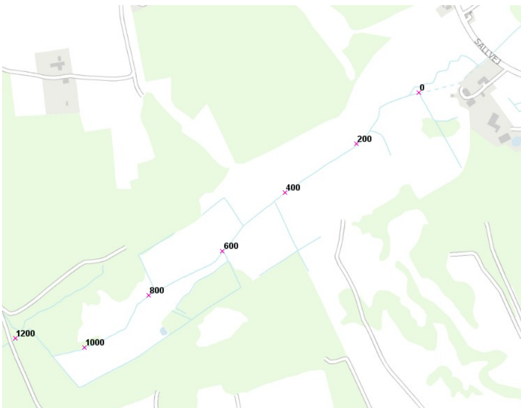
Figur 1. Hammel Møllebæk med stationering