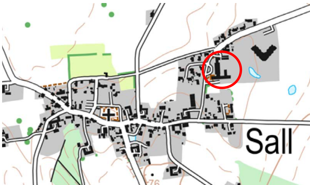
Oversigtskort for placering af Frijsendal friskole.