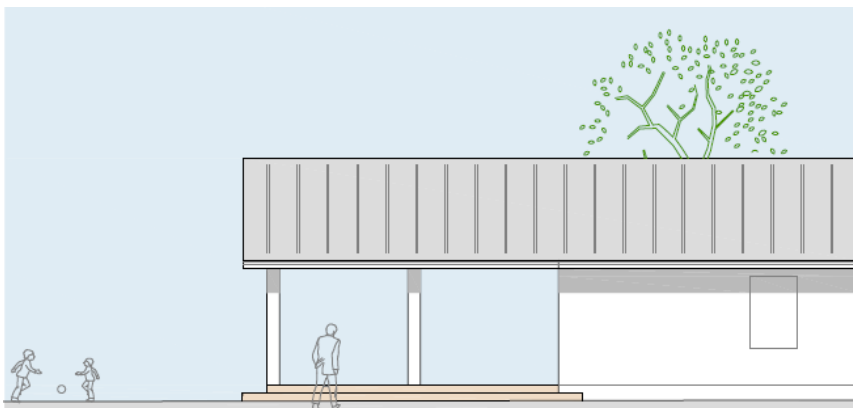
Facade set fra Vest.