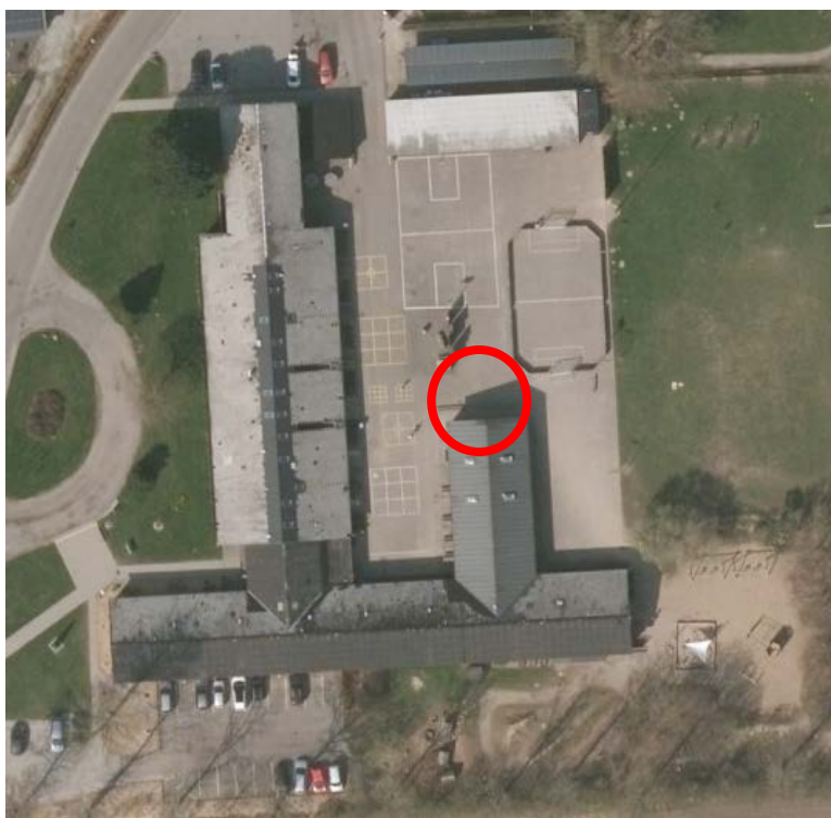
Oversigtsfoto for etablering af den overdækkede scene i forlængelse af musiklokalet.

Tilladelsen bortfalder, hvis den ikke er udnyttet inden 5 år efter den er meddelt.