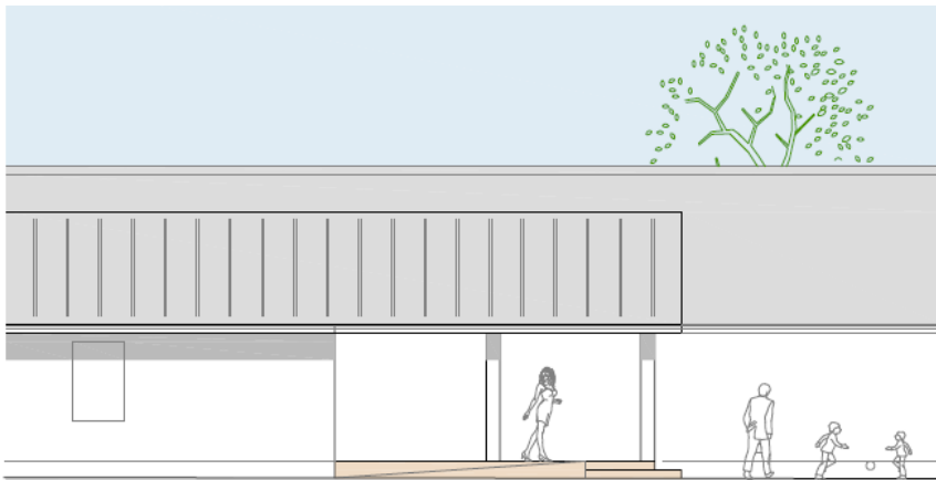
Facade set øst.