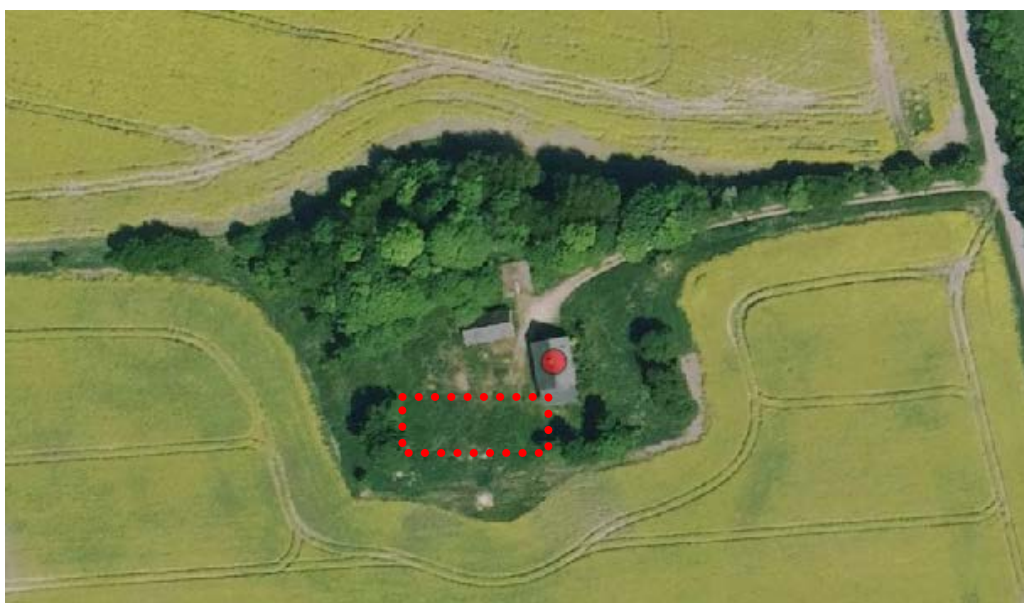
Lufffoto nr. 1 Ejendommen Skytsbjergvej 25 – Bygningen markeret med en rød prik er den eksisterende bolig som vil blive nedrevet når det nyt enfamilieshus er opført. Huset opføres inden for det stiplede areal. (se bilag 1.)

Tilladelsen bortfalder, hvis den ikke er udnyttet inden 5 år efter den er meddelt.