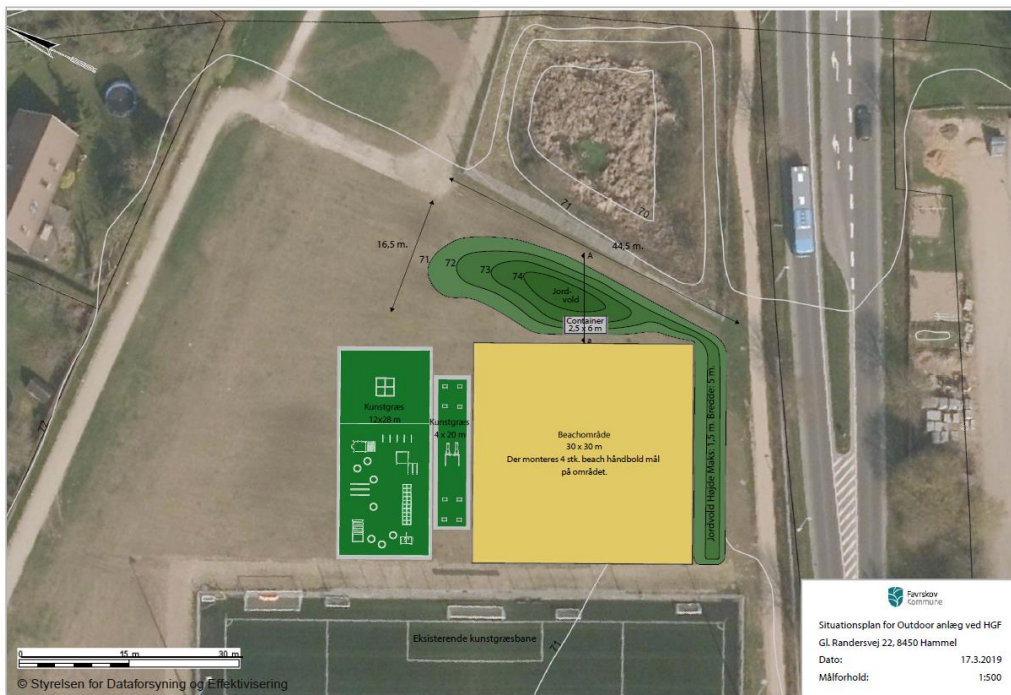
Figur 1. indretning af projektområdet

Projektet omfatter etablering af sandområde primært til strandhåndbold og –volleyball og et kunstgræsområde til fitness med diverse redskaber. Områderne placeres i tilknytning til eksisterende kunstgræsbane på Hammel Stadion. Placering og indretning af projektområdet ses på nedenstående figur og i bilag 1.