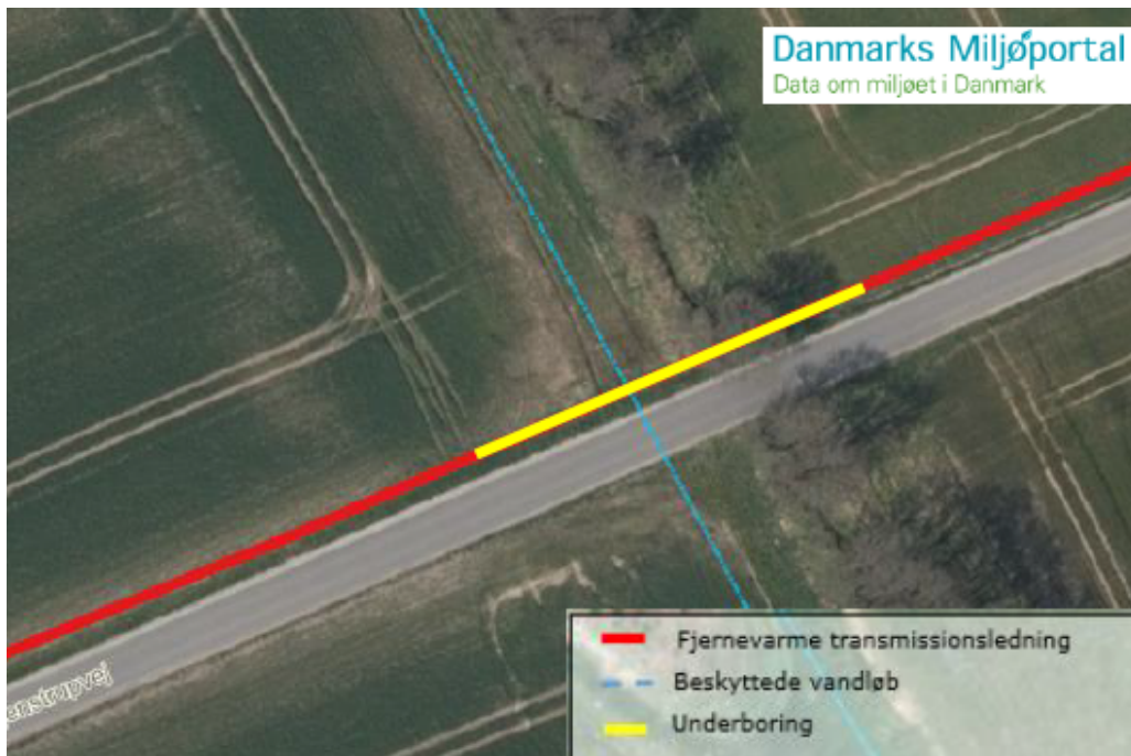
Fig. 2 Krydsning af Danstrup Bæk.