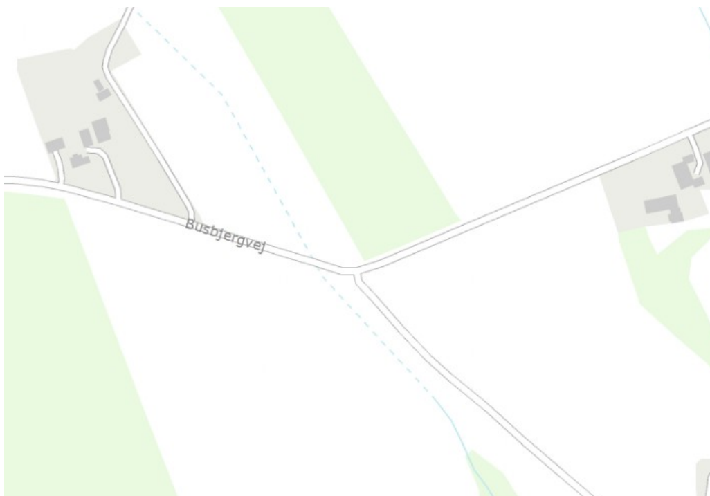
Fig. 3 krydsning af Stærkær sker nord for Busbjergvej.