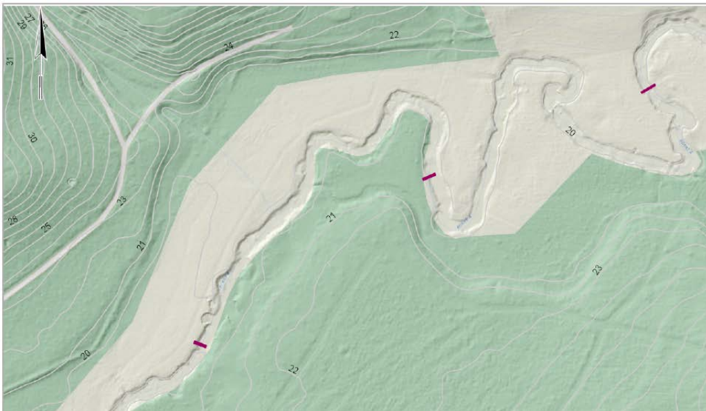
Gangbroernes placering i å dalen

Tilladelsen bortfalder, hvis den ikke er udnyttet inden 5 år efter den er meddelt.