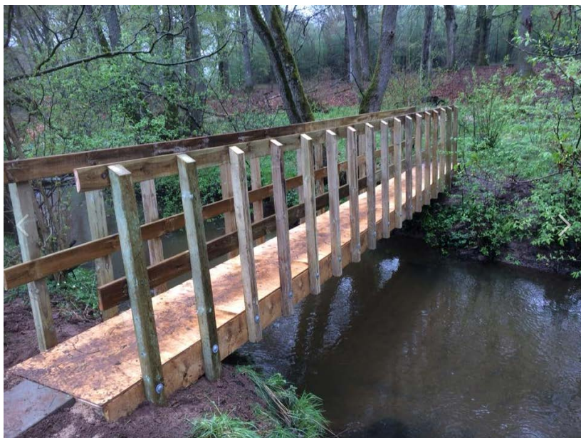
Eksempel på en af broerne over Borre Å.

Det er tanken at de tre gangbroer i fremtiden skal gøre det muligt for bl.a. borgere fra lokalområde at færdes i ådalen og benytte denne som rekreativt område.