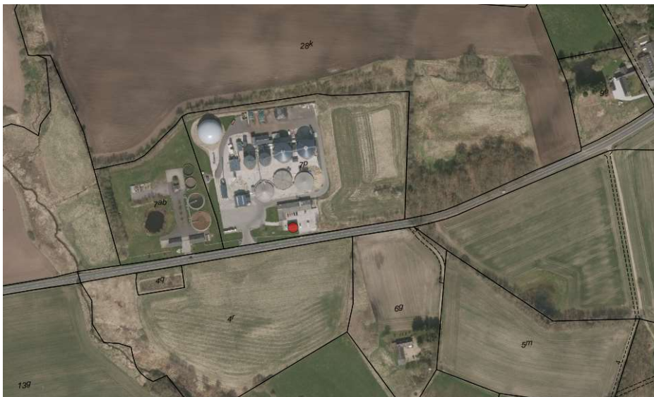
Thorsø Biogasanlæg, Kongensbrovej 10, 8881 Thorsø

Ejendommens beliggenhed fremgår af nedenstående kort udsnit.