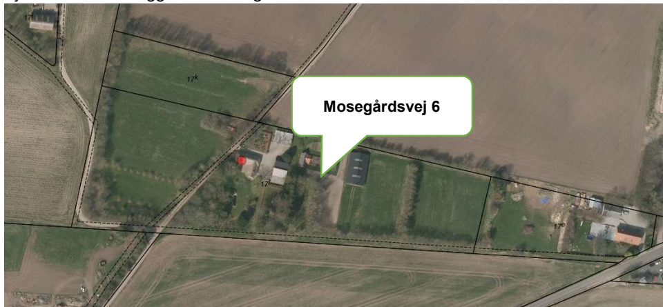
Ejendommen med adressen Mosegårdsvej 6, 8450 Hammel

Ejendommens beliggenhed fremgår af nedenstående kort udsnit.