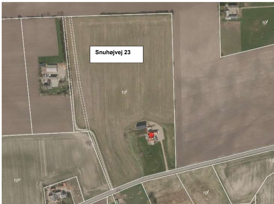
Snuhøjvej 23, 8881 Thorsø

Ejendommens beliggenhed fremgår af nedenstående luftfoto.