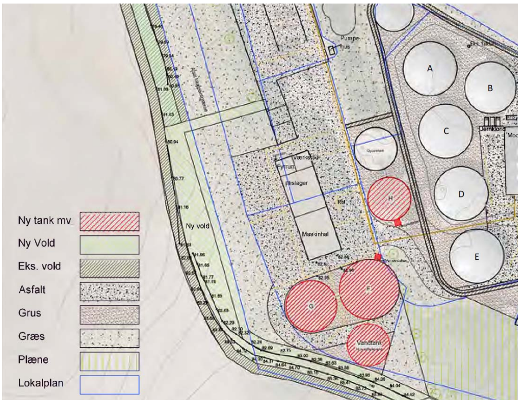
Situationsplan for placering af de nye tanke F,G,H og vandtank.

De to lagertanke |F| og |G| placeres umiddelbart syd for maskinhallen. Det fysiske udtryk af tankene vil være i lighed med de eksisterende tanke, i højde, omfang og farve. Tankene er i beton og udvendigt beklædt med en plade i farven antricitgrå (Ral 7016). Tankene overdækkes med en kegleformet grå dug (Ral 7037). Spidsen af dugen bliver