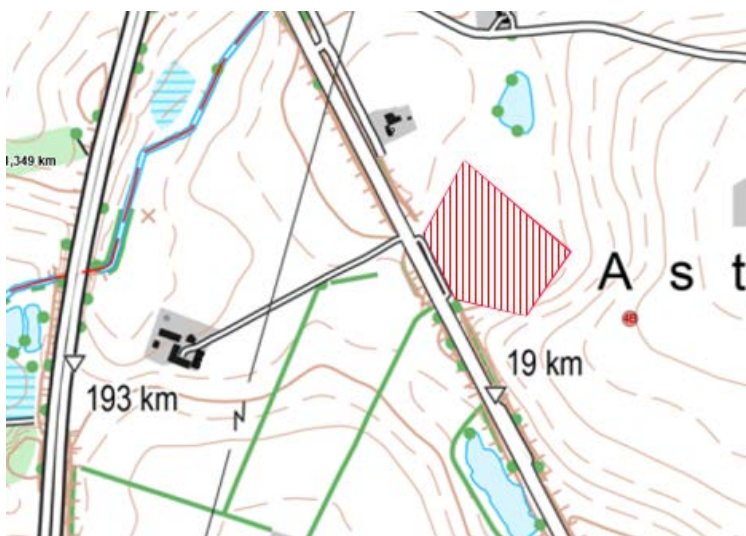
Området indenfor hvilket der kan foretages terrænregulering.

Tilladelsen offentliggøres på kommunens hjemmeside 16. august 2019. Du må først udnytte tilladelsen, når klagefristen på 4 uger er udløbet. Du vil få besked, hvis der indgives klage. Klagefristen er 13. september 2019.